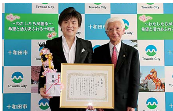
人を大切に思う気持ちを歌った「First Love ~この地球のどこかで~」をカーネギーホールで披露したいと市長に伝えました