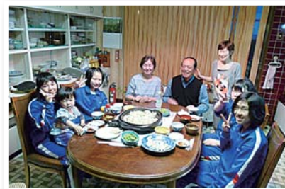
▼ 修学旅行生との夕食の様子