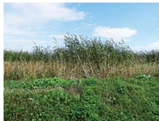
耕作放棄地の一例

遊休農地にしておくと雑草の繁茂や種子の飛散・病害虫の発生などにより周辺の農地に悪影響を及ぼすとともに、ごみなどを不法投棄される恐れもあります。また、遊休農地に認定されたまま放置していると固定資産税の課税が現行の1・8倍になる場合もあります。