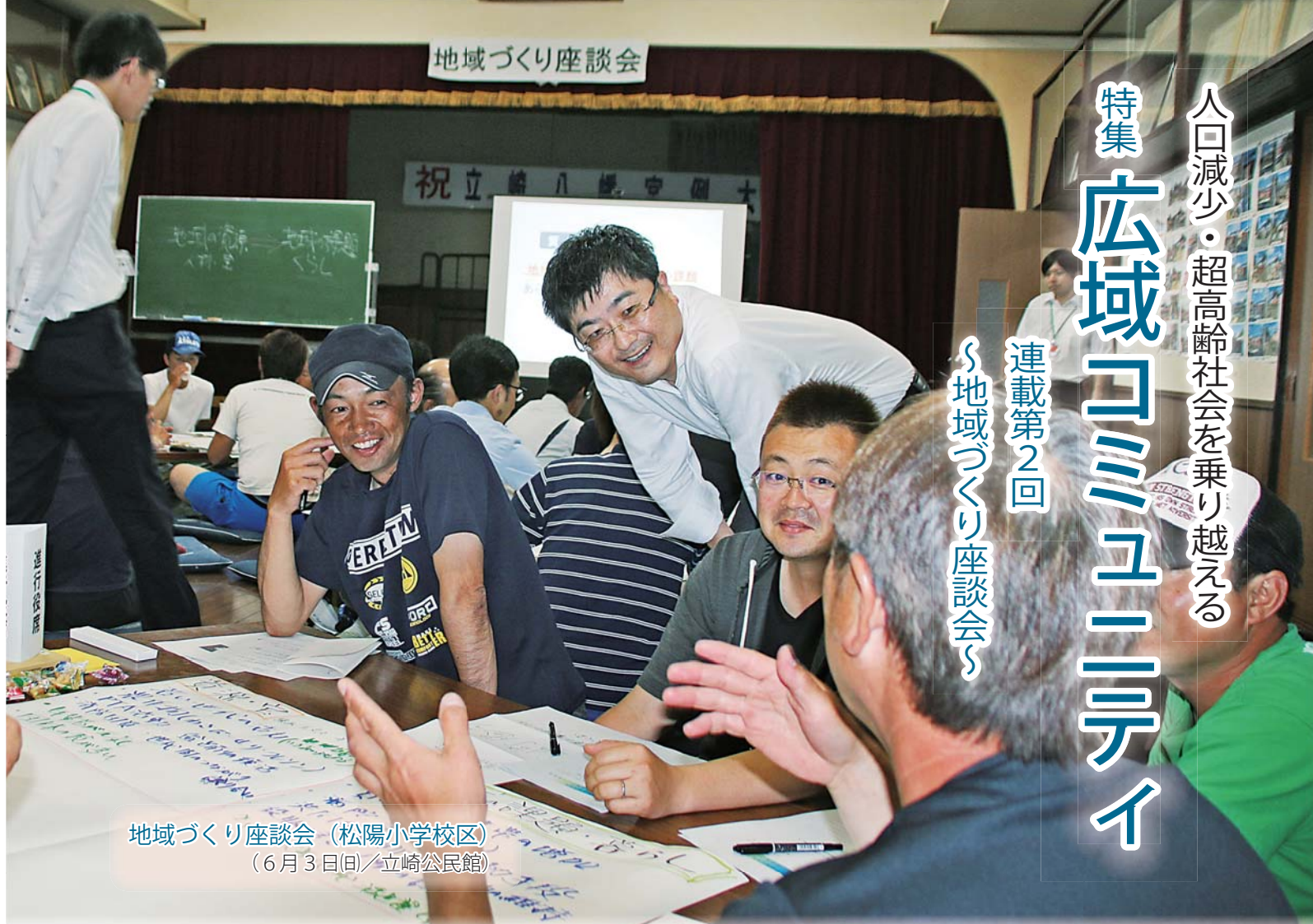
地域づくり座談会（松陽小学校区） （6月3日（日）／立崎公民館）

平成30年7月号掲載の特集「広域コミュニティ」連載第1回では、人口減少・超高齢社会を乗り越えるために「広域コミュニティ」という考え方があることを紹介しました。今回の特集では、市が「広域コミュニティ」づくりを推進していくに当たり、地域住民の「広域コミュニティ」への理解と気運の醸成を目的として取り組んでいる「地域づくり座談会」を紹介いたします。