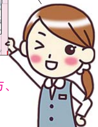
平成31年度版「家庭ごみの出し方、収集日程表」

広報とわだ3月号と一緒に配布しました。まちづくり支援課、西コミュニティセンターでも配布しているほか、市のホームページでもご覧いただけます。