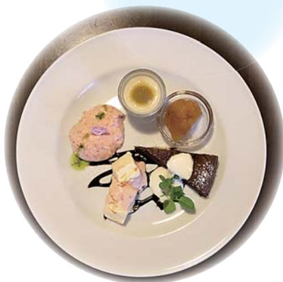
cafe orta 「スイーツプレート」