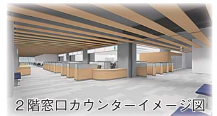
2階窓口カウンターイメージ図

カウンター窓口に仕切りを設置し、プライバシーに配慮した造りになっています（一部を除く）。