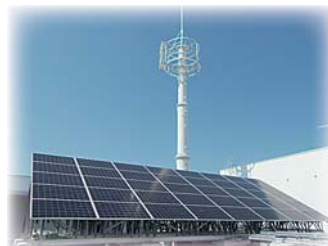
【太陽光発電・防災無線】

災害などによる、停電時の庁舎機能を維持するためのバックアップ電源や防災拠点の非常用電源として使用でき、72時間の発電が可能となっています。