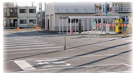
本館（新庁舎）北側の駐車場・駐輪場