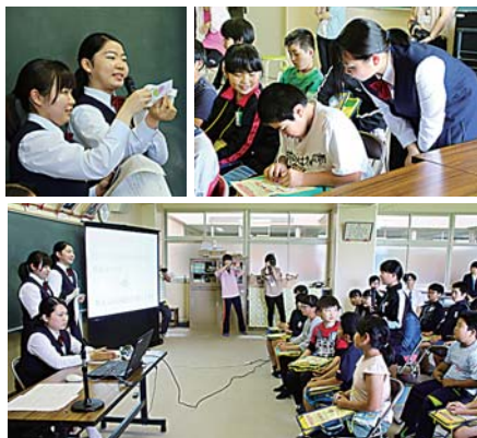
沢田小で行われた西高生による授業

家庭クラブ員が講師となって、市立沢田小学校の4~6年生の児童にSCの啓発授業を行いました。生徒はSCがどういう取り組みか話し、児童と一緒に宣言カードを作成。自分たちの身近なところからSCに取り組んでいこうと呼び掛けていました。