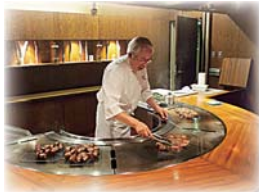
【昨年の料理の一例】

1946年 東京生まれ フランス料理をベースに、からだに安全でおいしいものにこだわった、ジャンルにとらわれない日本発の洋食として独自の無国籍料理を生み出す。 料理人としてお客様の口に入るものには絶対的な責任を持ちたい、という姿勢を变えることなく“食を通して日本を元気に”全国の産地を訪問し続けている。