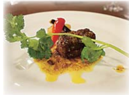
十和田湖和牛ロース肉の網焼き、X.O. 醬ソース