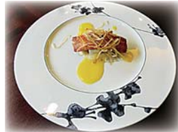
十和田湖ひめますの自家製スモークのポワレ、地元カリフラワーのピュレ、長芋添え