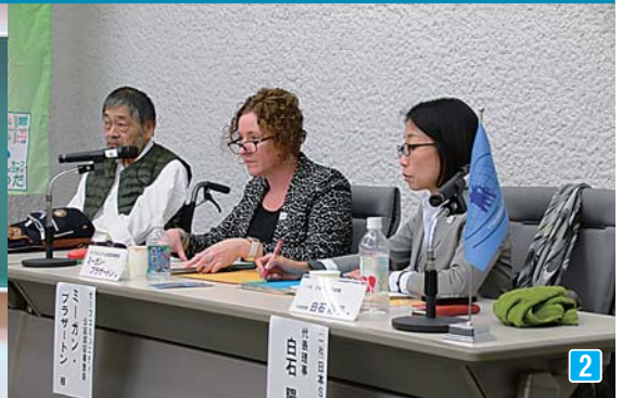
1 SCに取り組む十和田西高生の皆さん 2 昨年、事前審査を行ったSC審査員ら 3 認証自治体首長らが一堂に（SC厚木大会） 4 北里大学生もSCを応援

本市では、「子どもの安全」や「自殺予防」など8分野を重点課題とし、官民一体となった対策部会を