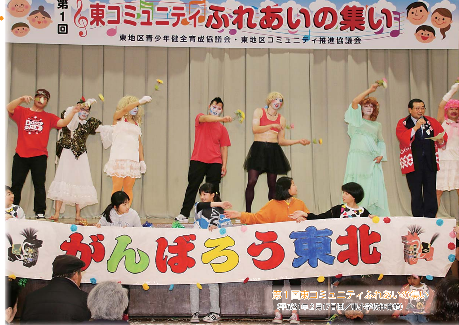
第1回東コミュニティふれあいの集い (平成31年2月17日(日)/東小学校体育館)