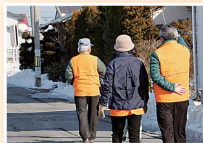
▲見守り活動の様子