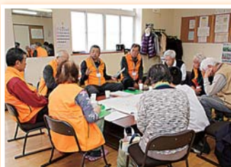
▲見守り活動者による話し合い