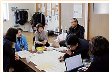
◀見守り活動者による話し合い