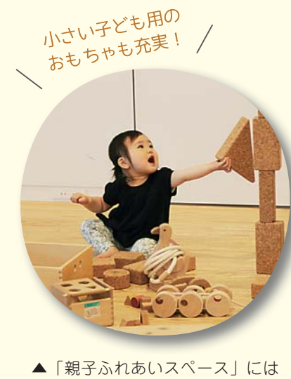
▲「親子ふれあいスペース」には積み木や輪投げなど木製のおもちゃがあり、親子で楽しく遊べます