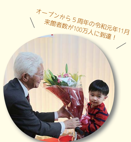
▲市長から来館100万人目の子どもに花束贈呈

▲「プレイルーム」は木のぬくもりを感じられる丘状の遊具のほか、「ままごとセット」や「ソフトブロック」などで遊ぶことができます