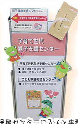
保健センターに入ると事務室への案内表示があります