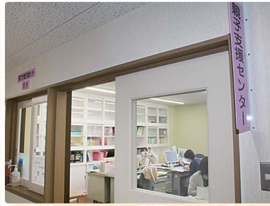
保健センター内に新設された事務室