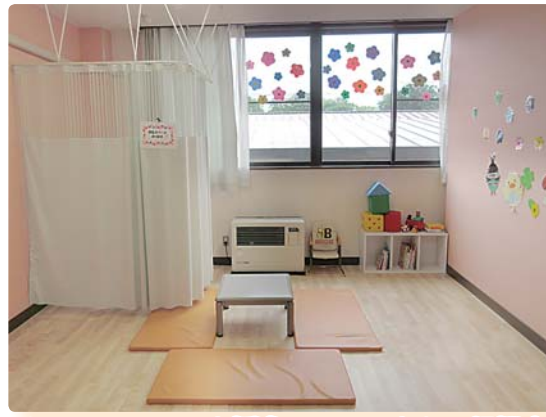
キッズスペースや授乳スペースもある相談室