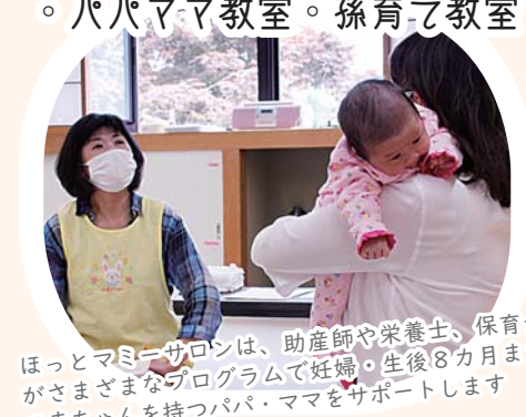
ほっとマミーサロンは、助産師や栄養士、保育士がさまざまなプログラムで妊婦・生後8カ月までの赤ちゃんを持つパパ・ママをサポートします