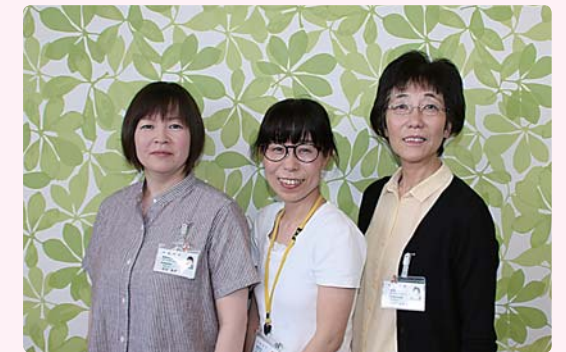
気軽にご相談ください