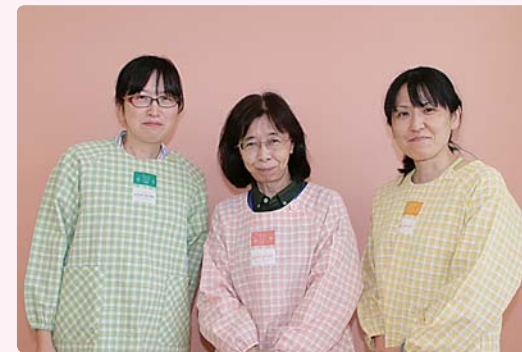
私たちがサポートします！