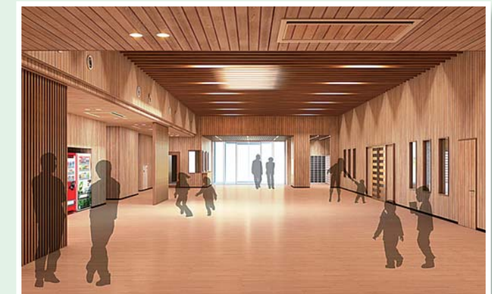
ホールイメージ図