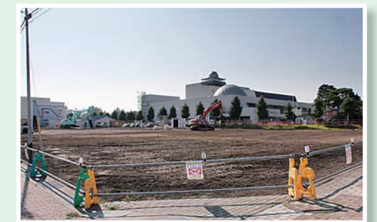
(新) 志道館建設予定地の現在の様子