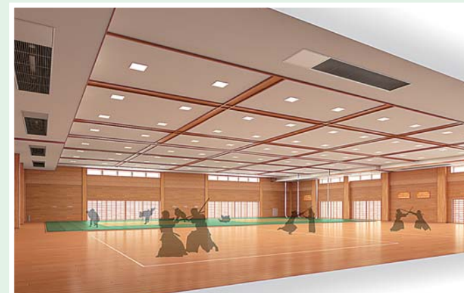
武道場イメージ図