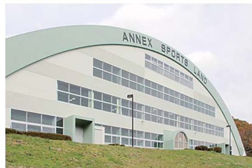
アネックススポーツランド (大字法量字焼山36-8)

アネックススポーツランドは、市が寄付を受けた屋内運動場などを改修し、平成23年11月にオープンしました。