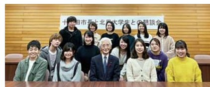
▲懇談会後の記念撮影