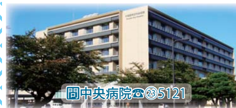
問中央病院 ☎ 235121

当院では、7つの看護分野で高いレベルの看護を実践するスペシャリスト「認定看護師」が勤務しています。今回は「皮膚・排泄ケア」分野の認定看護師を紹介します。