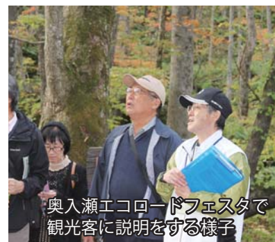
奥入瀬エコロードフェスタで 観光客に説明をする様子

感染症の影響で少なくなっていますが、各種イベントでも業務を行います。過去の奥入瀬溪流エコロードフェスタでは、チケット販売の補助、駐車場案内の他、観光名所の説明なども行いました。