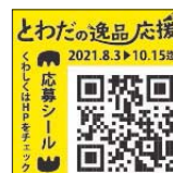
とわだの逸品シール

「とわだの逸品シール」のQRコードから専用サイトにアクセスし、専用フォームからご応募ください。