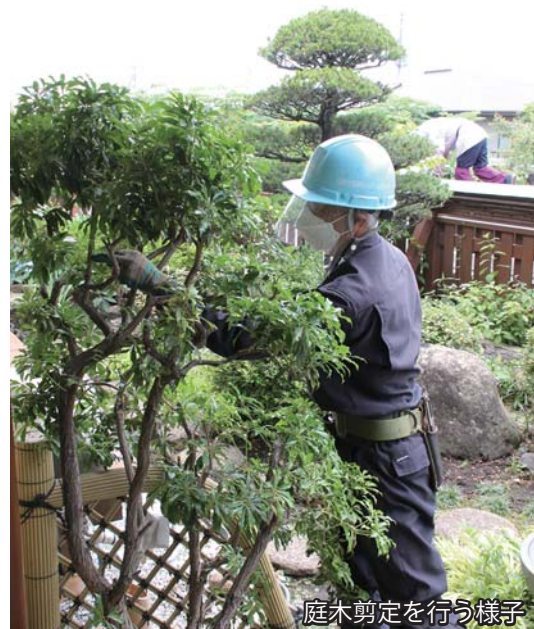
庭木剪定を行う様子

会員にとって経験の少ない仕事でも、各種講習会やスキルアップ研修のほか、さまざまな技能を持つ先輩会員と取り組むことで技能を学び、自信を持って就業することができます。