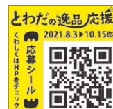
とわだの逸品シール

「とわだの逸品シール」のQRコードから専用サイトにアクセスし、専用フォームからご応募ください。