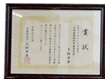
ふるさとあおもり景観賞

この賞は、照明技術の普及と発達に貢献する施設に贈られるもので、間接照明やダウンライトなどを用途に応じて使い分けることで多様な空間を創出していることが評価されました。