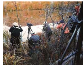
▲デッキからはみ出し