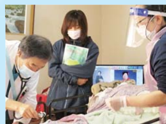
▲在宅訪問診療の様子