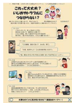
▲いじめ防止啓発リーフレット

これまでのキャンペーンや各学校での「いじめ防止」に向けた取り組み、作成したリーフレットなどを市ホームページに掲載していますので、ぜひご覧ください。