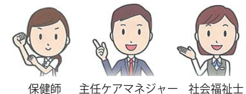
保健師 主任ケアマネジャー 社会福祉士