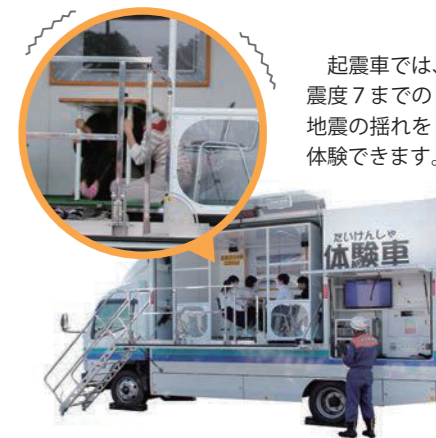
起震車では、震度7までの地震の揺れを体験できます。