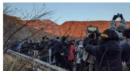
▲デッキの混雑、トラブルなどの発生