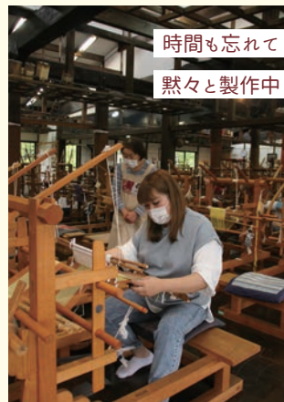
時間も忘れて黙々と製作中