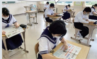
朝読書で紙面の新聞を閲覧