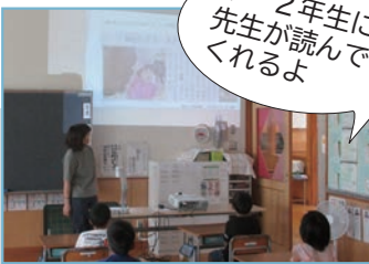
記事をプロジェクターで投影