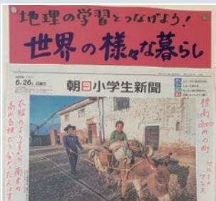
学習内容に関連する記事を活用し、学習内容の理解を深めます