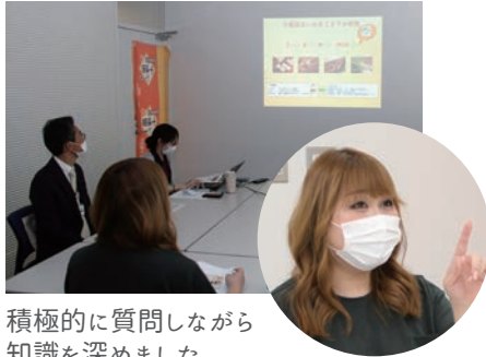
積極的に質問しながら知識を深めました

市役所で勉強会を行い、「やませ」が吹く冷涼な気候である十和田市で育てられている野菜の特徴や、健康な土づくりの秘訣などを学びました。