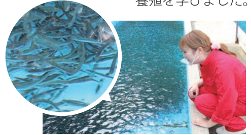
元気に泳ぐヒメマスの稚魚がいっぱい！！

十和田湖ふ化場を見学し、放流された稚魚が十和田湖のきれいな水で育ち、産卵時に本能的にふ化場を目指して戻ってくる習性を生かしたヒメマスの養殖を学びました。