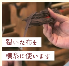
裂いた布を横糸に使用します