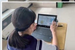
パソコンで電子版新聞の閲覧