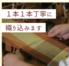
1本1本丁寧に織り込みます