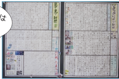
学習のまとめにグループで新聞作成