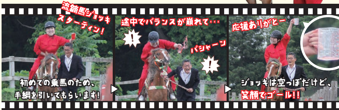
流鏑馬ジョッキスタートイン!

「流鏑馬ジョッキ」ではジョッキーがジョッキを持って走行し、どれだけ水をこぼさずにゴールできるかを競います。