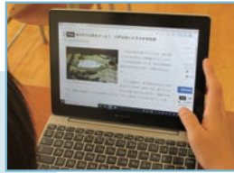
朝の「学びタイム」で電子版新聞を閲覧