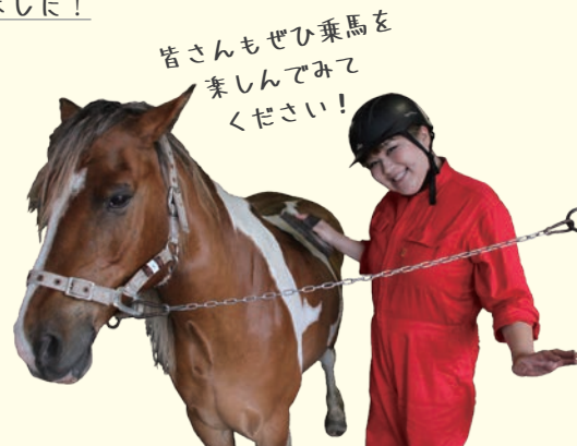
皆さんもぜひ乗馬を楽しんでみてください!