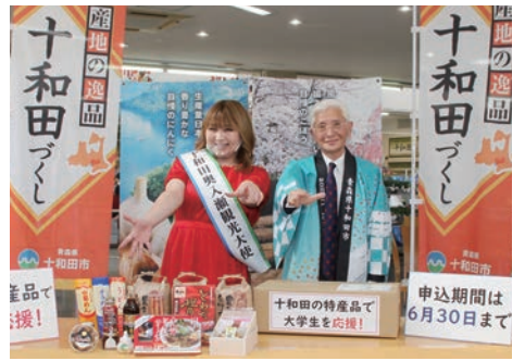
大学生への支援事業で市の特産品をPR