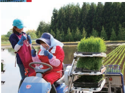
学生の頃以来の田植えで懐かしい！初めての田植え機も楽しかったです！