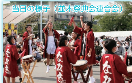
当日の様子（並木祭典会連合会）

■コロナで修学旅行も体育祭もなくなってしまった。3年分のストレスを大太鼓にぶつけて、秋まつりを楽しみたい。（大太鼓・高校生・並木）