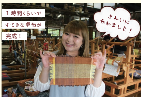
1時間くらいですてきな卓布が完成!