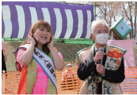
春まつりにゲスト出演。桜流鏝馬の実況にも挑戦