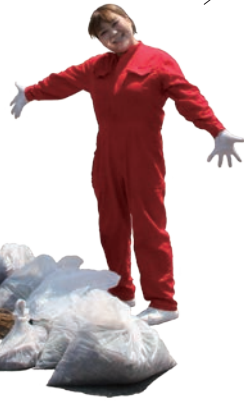
げんびサポーターの皆さんと交流しながら、落ち葉や雑草を集めました