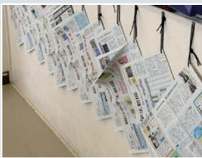
各教室で気軽に新聞を読むことができます