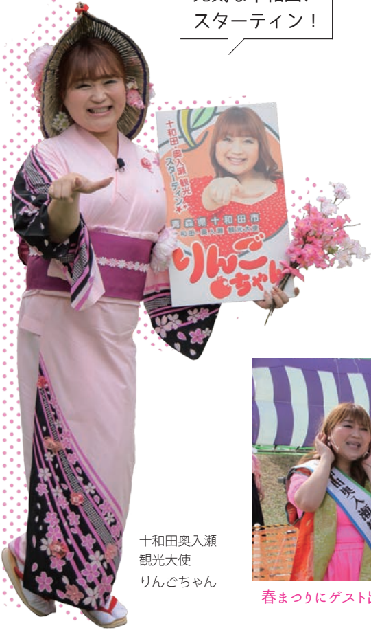
十和田奥入瀬 観光大使 りんごちゃん

十和田奥入瀬観光大使として、本市の観光や特産品のPRをはじめとしたさまざまな活動をしている、本市出身のタレント「りんごちゃん」。