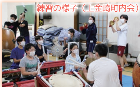
練習の様子（上金崎町内会）

■ かね 鉦を叩いて、伸びるようないい音が出ると気持ちがいい！場所によって音がこもってしまうのが難しい。（鉦・高校生・上金崎）