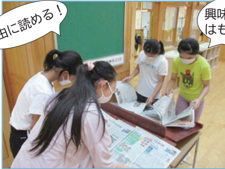
多目的ホールの新聞コーナー