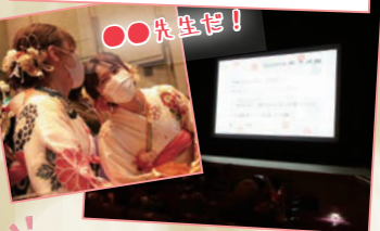
小・中学校、高校の先生方からのメッセージをスライドショーで上映しました