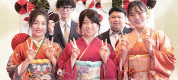
二十歳のつどい実行委員会の皆さん

パンフレットや看板、会場 で上映したスライドショー を作成しました! みんなの思い出に残る 日になってほしい!