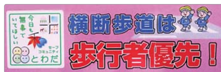
▲「横断歩道は歩行者優先」ステッカー