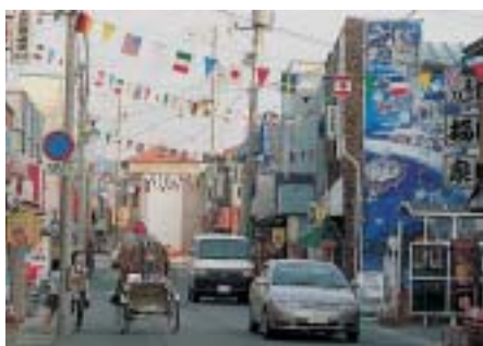
「アート@つちざわ」の風景

友好都市である花巻市の旧東和町地区では、「街かど美術館アート@つちざわ」が行われました。古い商店街の空き店舗などを活用して、約1カ月間200人の作品が展示されました。また、青森市では新町商店街のメンバーが実行委員となった「怒涛のつー青森アート商店街」が開催され、空き店舗を利用した若手アーティストの作品制作のほか、フォーラムや子ども向けのワークショップなどが行われました。