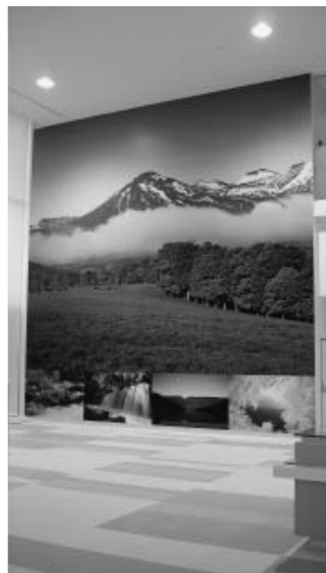
1階大パノラマ写真