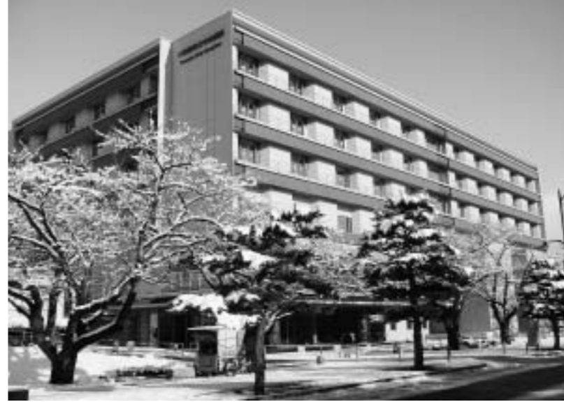
十和田市立中央病院新本館

十和田市立中央病院の新本館が平成19年12月に完成しました。開院は平成20年5月7日を予定しています。現在は、新病院本館への医療機器などの搬入・据付、電子カルテの操作練習、業務内容の見直しなど、開院に向けて準備をしています。新病院開院後は、現在の東棟を解体し、その跡地を駐車場に整備します。また、西棟の改修も行い、新病