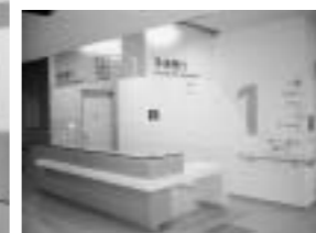
1階外来ブロック受付