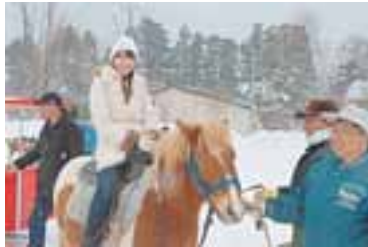
ホーストレッキング 土・日曜日、祝日 10:30～14:00