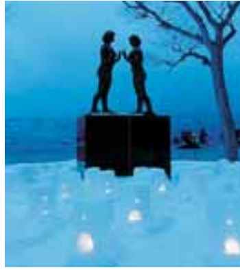
乙女の像ライトアップ 期間中毎日 17:00～21:00

開催期間 1月30日(金)～2月22日(日) 会場 十和田湖畔休屋イベント会場 問い合わせ先 十和田湖冬物語実行委員会事務局 (社)十和田湖国立公園協会内 ☎(75)2425)