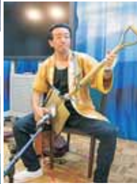
スコップ三味線大会 in 十和田湖冬物語 2月8日(日) 受付11:00 大会13:00