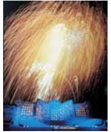
冬花火 期間中毎日 20:00～(約10分)