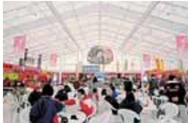
食彩ドーム 期間中毎日 平日 15:00～21:00 土・日曜日、祝日 11:00～21:00