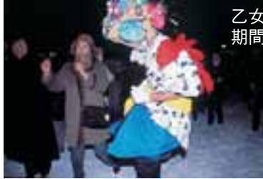
ねぶたハネト体験 期間中毎日 19:15～