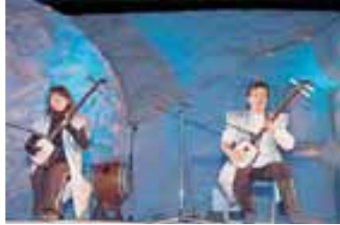
津軽三味線ライブ 期間中毎日 19:05～