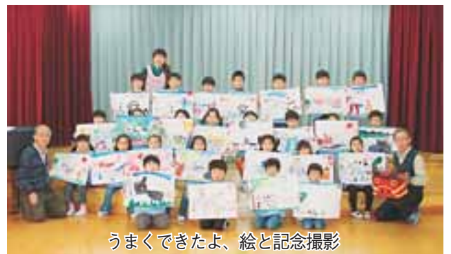
うまくできたよ、絵と記念撮影