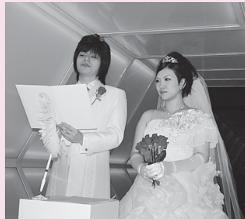
アナ・ラウラ・アラエズ作「光の橋」での二人