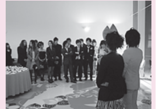
参列者に挨拶する二人