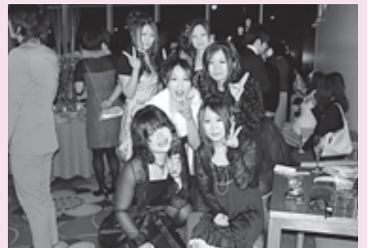
挙式に参列した参加者