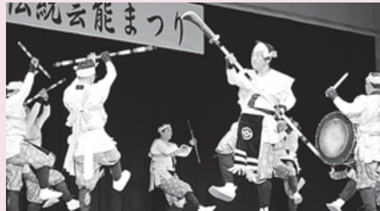
南部駒踊相坂若駒会「セツ舞」