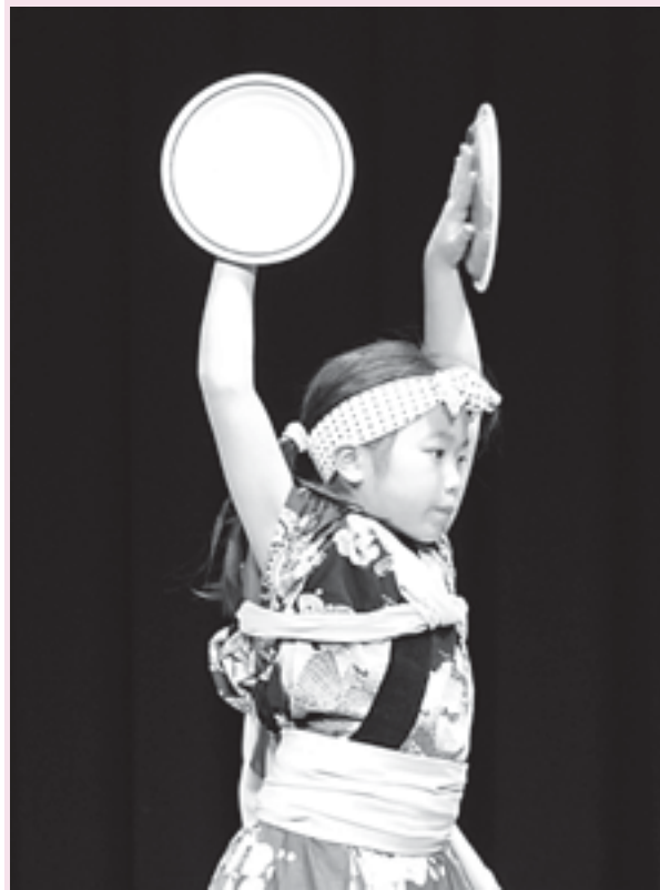
三日市神楽保存会「盆舞」