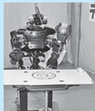
アンパンマンの似顔絵を描く DiGORO

8月1日、株式会社まちづくり十和田が主催する街ロボフェスタが中央商店街の市民ふれあいホールで開催されました。会場では東京都にある電気通信大学が開発し、今年のロボcup世界大会で優勝した知能ロボット「DiGORO」がアンパンマンの似顔絵を描いたり、事前に記憶した人の顔と声を基に周囲の人の中から特定の人を探し出したりするデモンストレーションが行われ、子どもたちは先端技術のロボットに興味を示していました。