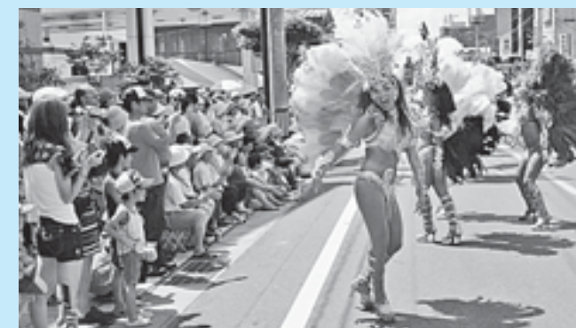
観客を魅了したパレード

8日のパレードは澄月寺から太素塚までの通りで行われ、レッスンを受けた子どもたちと保護者、サンバ愛好者で構成する地元チーム「オス・サンボンギ」や、東京都からプロのバンドとブラジル人ダンサーで構成する「サッシペレレ」、浅草サンバカーニバルで昨年優勝した実力チーム「バルバロス」が参加。夏の日差しが降り注ぐ中、サンバのリズムに乗ってエネルギッシュなパレードを披露するダンサーに沿道の観客からたくさんの声援が送られていました。