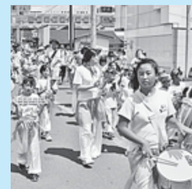
オス・サンボンギは約100人が参加