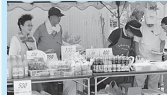
東京十和田会の会員による十和田市産の物産販売

7月24日、東京都墨田区で立川・菊川連合町内会による立菊サマーフェスティバルが開催され、東京十和田会や市観光協会の会員が十和田市産の物産販売をとおして本市のPRを行いました。フェスティバルには地域間交流の拡大を目指して、昨年参加しているもので、十和田バラ焼きの試食やスタミナ源たれ、にんにくなどの販売、ツリーイングの実演、パンフレットで美しい自然を紹介しました。訪れた区民から「十和田に行ってみよう」などの声寄せられていました。