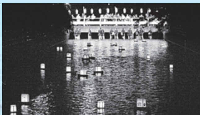
稲生川に浮かぶ灯ろう