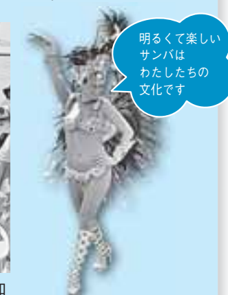
明るくて楽しい サンバは わたしたちの 文化です