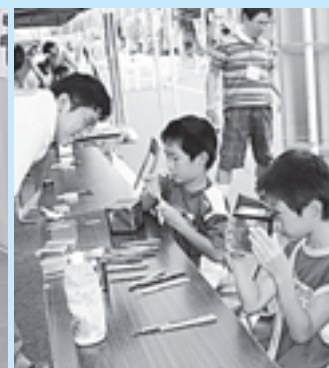
工作教室で作った万華鏡を覗き込む子どもたち