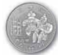
青森県の記念貨幣