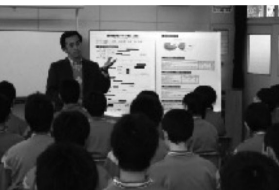
講師を務めた沼田さんは生徒に「いのちを簡単に捨てるな。これからもっとおもしろいことがあるぞ」と熱く語りかけていた。

その他のおもな相談窓口の紹介 DVホットライン 0120-87-3081 ※24時間対応 青森県女性相談所 017-781-2000 上北地方健康福祉子どもセンター福祉部(配偶者暴力相談支援センター) 0176-62-2145 十和田警察署 0176-23-3195