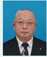
十和田市議会議長 石橋 義雄